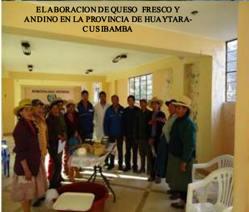
ELABORACION DE QUESO FRESCO Y ANDINO EN LA PROVINCIA DE HUAYTARA- CUSIBAMBA