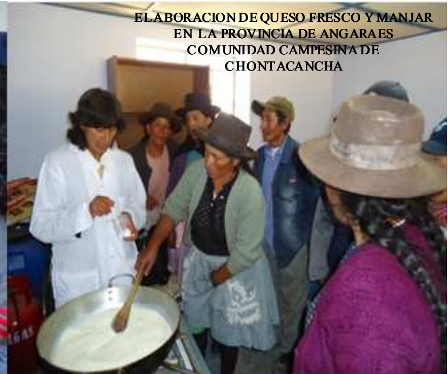
ELABORACION DE QUESO FRESCO Y MANJAR EN LA PROVINCIA DE ANGARAES COMUNIDAD CAMPESINA DE CHONTACANCHA